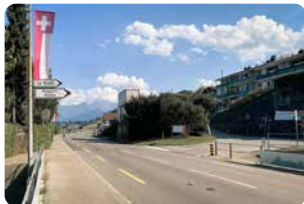
Abzweigung auf Stationsweg